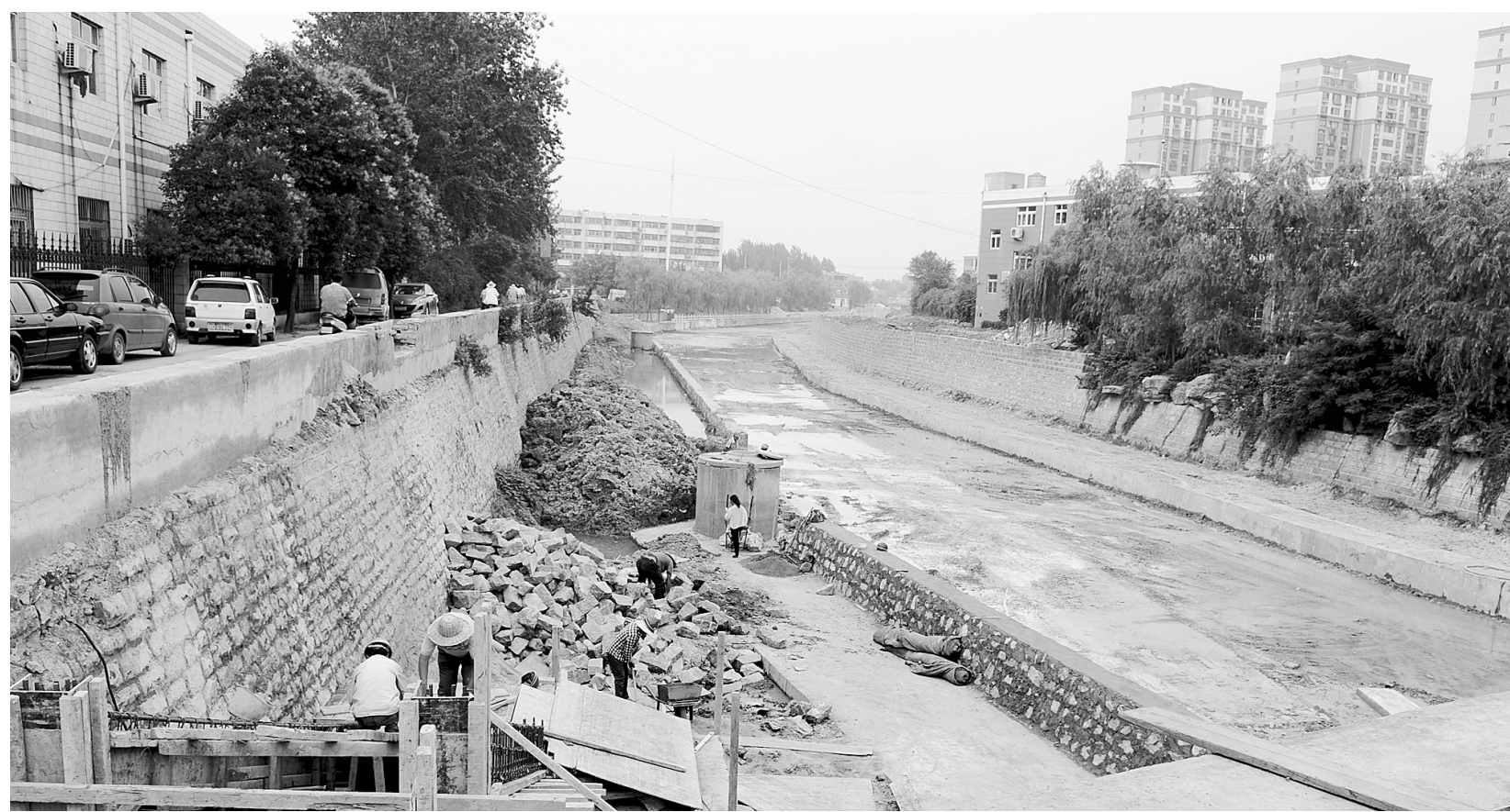
正在施工中的文化路河道。