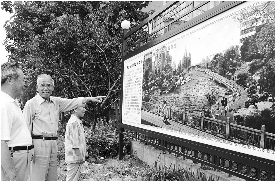
东沙河治理工程牵动许多市民关注。