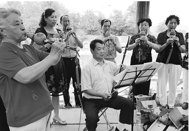
“初具规模”的光明路段已成为市民休闲、游憩的场所。

宽阔整洁的河道、曲径幽深的长廊、繁花似锦的景观、焕发生机的老桥、忙碌有序的施工——随着快门的按动,10公里东沙河上的美景蓝图透过记者的镜头瞬间定格在相机的储存记忆里。