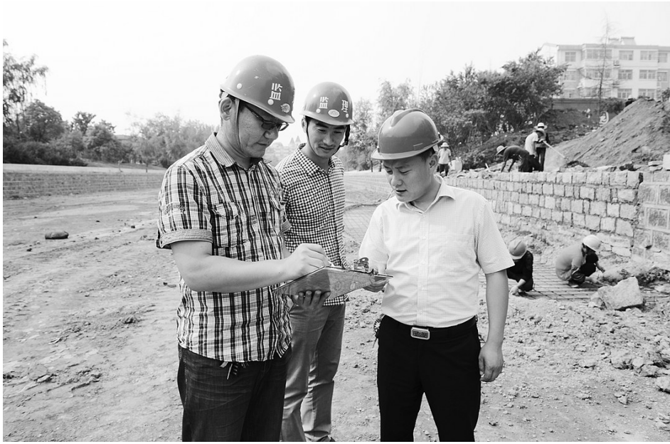
为确保工程高质量完成,工程监理人员每天坚守在一线。