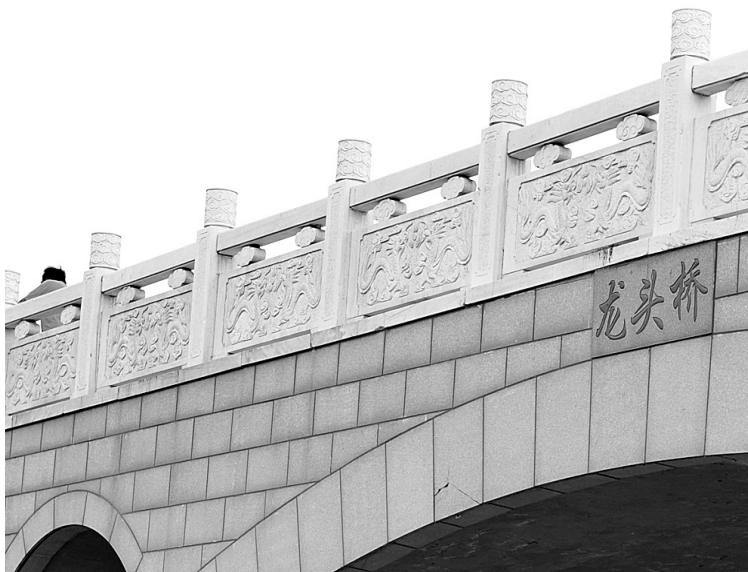
焕然一新的龙头桥。

整体工程预计今年12月份完工,到那时“一河清水、两岸畅通、景观优美、功能完善”的东沙河将形成沿河景观生态长廊,为居民提供一个休闲、游憩的场所,成为老城区又一道靓丽的风景线。