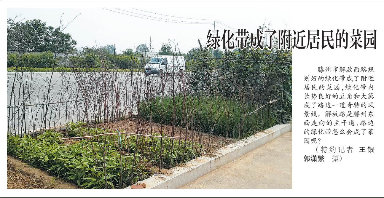
绿化带成了附近居民的菜园

本报讯 “滕州现在的路边烧烤摊是越来越厉害了，油烟肆意吹，何时是个头？”日前，有读者拨打本报新闻热线反映滕州露天烧烤的情况时说，希望有关部门能出面管一管。 接到读者电话后，记者于16、17号两天晚上对滕州的露天烧烤进行了采访。 在大同路转盘西侧，道路两旁有五、六家露天烧烤摊，每家摊点的人行道外均摆放着不少的小方桌，已有不少食客在此就餐。烧烤炉摆在路边，烧烤师傅正不停地翻动着炉子上的烧串，炉子外侧一只大型的电风扇肆无忌惮地把烧烤产生的油烟吹向马路中间。从此通过的不管是行人，还是骑车人都加快速度，掩面捂鼻冲过去，过往车辆均关上车窗，加速通过。 记者随机采访了刚刚从此通过的市民王先生和刘女士，王先生说：“刚才路过烧烤摊时，一股股热乎乎的刺鼻油烟扑面而来，有焦糊味、腥臊味、辛辣味还有烟火味，夹杂着扑在脸上、身上，真张不开嘴、透不过气。”刘女士气愤地说：“人行道被占了，只能走路中间，从吹过来的油烟中间，这种烧烤的油烟味沾在衣服上，一两天也去不了，真烦人。” 在解放西路香格里拉小区路段两侧有五六家露天烧烤摊，还有三处大的烧烤城。在远航国际城小区附近，同样有好几家烧烤摊，每处的情况也和大同路转盘西的情况差不多了。 看到记者采访，家住藩阳街的村民朱大妈说“每天晚上整个院子里飘的都是这种烧烤味，听说这种气味对身体有害，我们家一直不敢开窗户透气。”远航国际城小区的居民张大爷说：“烧烤城里放音乐的喇叭声更是吵得人不能入睡，经营户制造的垃圾也不及时清理，很影响环境。” 正在烧烤城里就餐的顾客吴先生说：“这种有烟烧烤吃着香，尤其是年轻人更愿意吃。但这种露天摊确实也不文明，不光桌子摆在人行道，就连吃饭的客人都被笼罩在烧烤产生的烟雾中。我们也期盼着能在环境好的烧烤摊就餐。” 对于油烟产生的污染，记者向有关专家求证。据专家介绍，这种烧烤产生的油烟中含有硫化物、一氧化碳、一氧化氮和灰尘，对人体危害比较大。硫化物刺激呼吸道粘膜，易引起呼吸道疾病；一氧化碳和一氧化氮易于血红蛋白结合，使人体缺氧而浑身无力、头痛、恶心、呕吐，严重的甚至会引起中毒休克；一氧化氮，刺激脑神经细胞，能使人发狂。专家建议烧烤摊主选择在有抽排烟设施的室内或采用新型的无烟烧烤炉烤制食品，还清洁空气给市民；同时也建议广大市民通过有烧烤油烟的路段时可选择戴上口罩，能够避免大部分油烟粒子进入口腔。 “有消息说，城管等部门正在对露天烧烤摊进行规范治理，希望能加快治理步伐，早日规范，让市民少受一些油烟熏烤的罪。”市民王先生对露天烧烤的整治，显得心情十分迫切。 （记者 焦兴田 特约记者 邵长富）