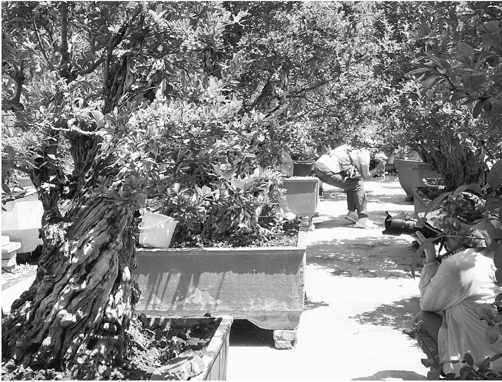
石榴盆景醉游人 盛夏时节，在峯城冠世榴园，石榴盆景吐红绽绿、千姿百态，令游人赏心悦目，流连忘返。目前，峯城区有上千人从事石榴盆景制作，有各类盆景金盆20万盆，总产值5000余万元，先后获得各类花卉大赛金奖银奖100余块。

（上接第一版）新型城镇化、服务业高端化、农业现代化“四化同步”推进为重点，以国家森林城市、国家园林城市、国家卫生城市、省级文明城市“四城同创”为抓手，以改革开放为动力，经济社会发展正逐步步入提速转型、跨越发展的高速轨道。