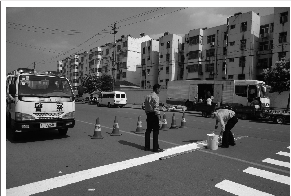
□通讯员 吴琛 葛玺 华山小区南门鑫昌路段，几名工作人员正在忙碌的绘制斑马线。据悉，华山小区南门交通流量大、学生多，无交通指示标志，居民的出行存在极大的安全隐患。文化路街道青檀社区积极协调市中交警大队在此路段绘制了斑马线，为居民的安全出行提供了保障。在践行了党的群众路线的同时，也为文明城市的创建添上了一道靓丽的风景线。

□通讯员 刘婷 本报讯 连日来，我区多措并举狠抓汛期安全生产工作，确保辖区居民安全度汛。 我区及早部署了全区汛期安全生产工作，对全区工矿企业、水库、城市防汛等汛期重点工作实行区级领导包保，全面加强预警监测、排淤清障、除险加固、应急值守各项工作，确保安全度汛。 我区全面开展汛期专项整治。在企业自查整改的基础上，结合安全生产“百日攻坚”活动，分行业组织开展了汛期专项检查整治活动，煤矿行业重点检查了“一通三防”、防治水和机电提运等情况，对存在的安全隐患，赶在汛期之前，全部进行了整改；非煤矿山企业重点检查了截水沟、排水系统和边坡安全稳定的情况；危险化学品企业重点检查了各类设施、管道的防雷、降温措施；民用爆破器材、烟花爆竹企业认真进行了防雨、防潮、防高温、防雷击的各项安全