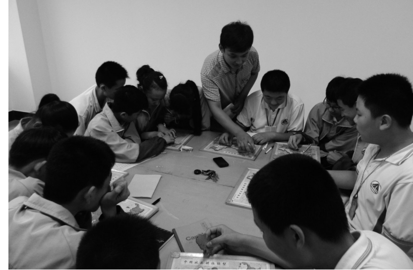
□通讯员 韩业海 为了丰富校园文化生活，四十一中开展了“个性社团，导师引领”全员育人活动。目前，该校每个级部根据学生的特长、爱好创设了“经纬天地”、“明鉴社”、“耕读社”等16个社团。