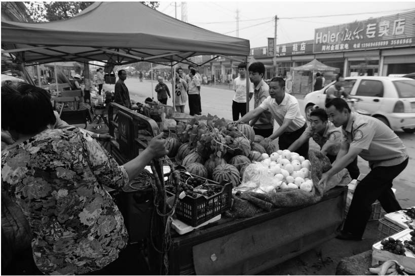
□通讯员 刘勇 为加大创城力度，6月17日，孟庄镇组织公路站、行政执法等相关部门对崖头农贸市场进行专项治理。此次行动，共出动执法车3辆，执法人员12名，整治占道经营30余处。

○周杨 刘复成 不甘平庸，为了实现创业梦，他走南闯北；发现商机，果敢行动，他三个月让想法变成现实；为了梦想，他坚持到底，60多个电话换来了5万元的启动资金。执着、坚韧成为他的身份标识，他就是枣庄首家机器人俱乐部的创始人焦开。 近日，记者来到了位于市体育馆内的枣庄乐高机器人俱乐部，在教室里碰巧遇到了来自临沂的客人。他们这次前来主要是就机器人教育进行学术交流和教育资源的共享。“枣庄机器人俱乐部这边的老师很有热情，而且非常的专业。让我们俱乐部的老师感到深深的折服和敬佩。”临沂乐高机器人俱乐部讲师陈嘉告诉记者。 枣庄乐高机器人俱乐部的负责人告诉记者，现在俱乐部发展很好，学术交流是常有的事情。俱乐部现在拥有员工近20人，在各市区设置了分校区4个，在校学生300多人，而“掌舵”这一切的就是俱乐部创始人焦开。然而，在三年前，机器人俱乐部还只是个“梦想”。那时候的焦开，满脑子都是创业的想法，为此他曾经到多地边打工边寻找项目，还专门到枣庄学院充电学习了3个月，终于功夫不负有心人，在安徽合肥工作时找到了机器人这个创业项目。“我本身家庭是农村的，自己也是大学刚毕业，手中也没有积蓄。在决定创业之后，就开始筹措资金，但是，给同学、亲戚打了60多个电话，只凑到了仅仅5万元启动资金。”焦开对记者说。 焦开告诉记者，决定创业的时候，最难的不是筹措资金。由于合肥的