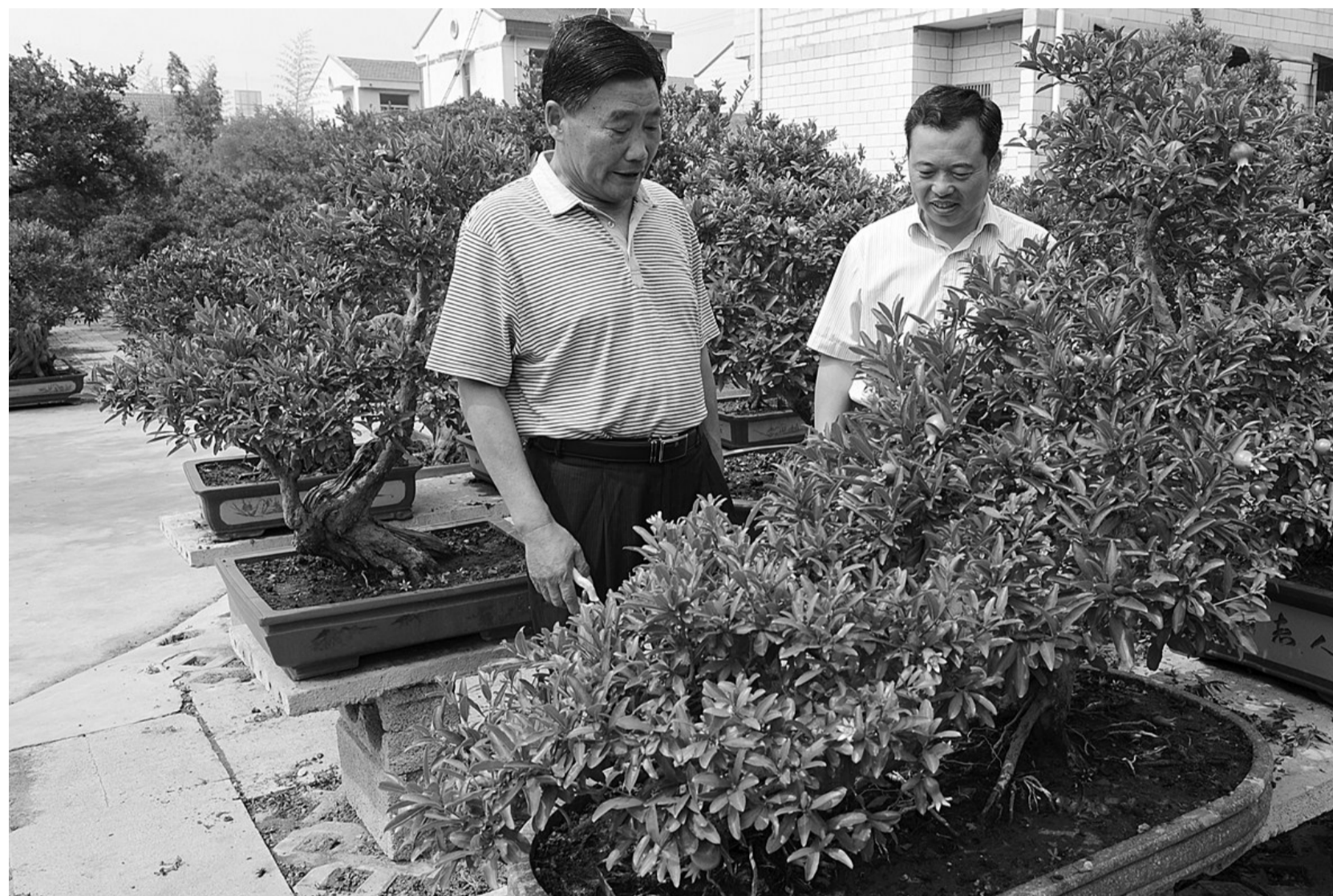
展示获得第七届中国花卉博览会金奖作品“凤还巢——大红袍”。