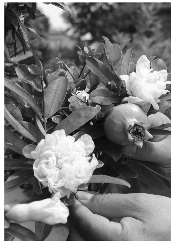
石榴极品——冰糖籽白牡丹。