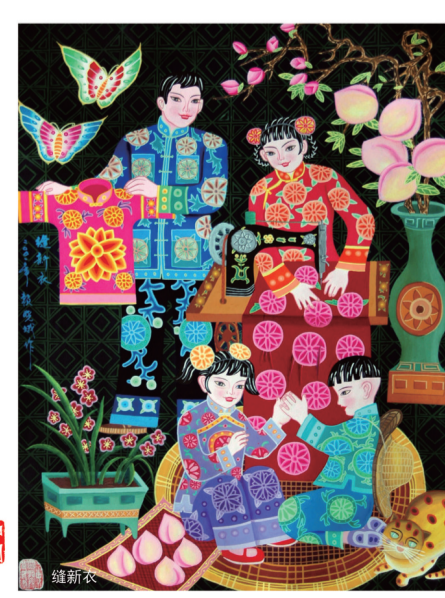
中国网络电视台制 广东龙门 谭池发作