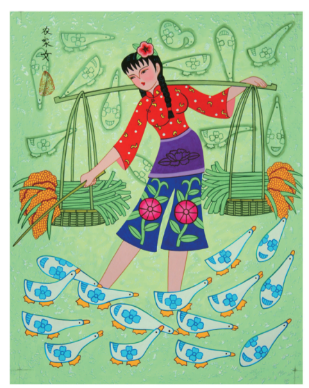
中国网络电视台制 广东龙门 陈少伟作