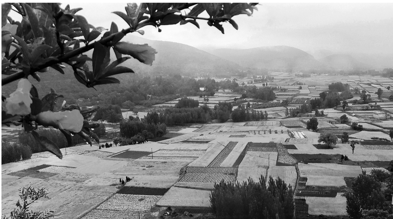
五月的田野

问题又来了,这样通过网络参观方式真的可以完全取代实地参观吗?作为辅助参观方式的3D功能,未来会成为主流方式吗?想来这些疑问还会在很长的一段时间内,成为艺术发展的重要课题。