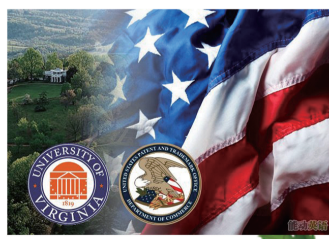
表音密码被破解，荣获美国专利