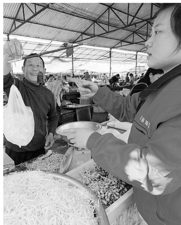
▲定期到市场帮商户“校秤”。