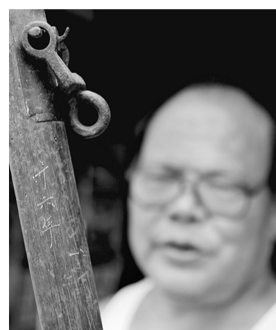
▲展示民国时期的“银星”秤王。