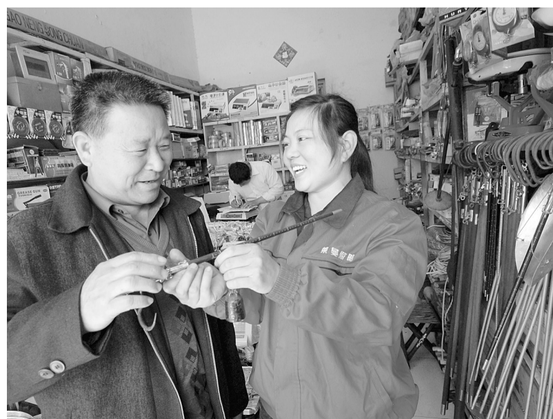
▲盈利虽小,诚信待客。