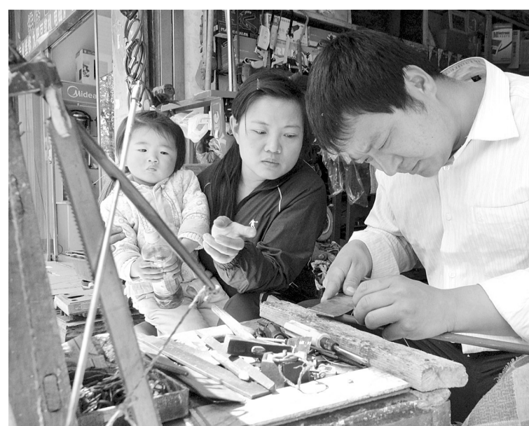
▲闲暇之余教丈夫做秤杆。