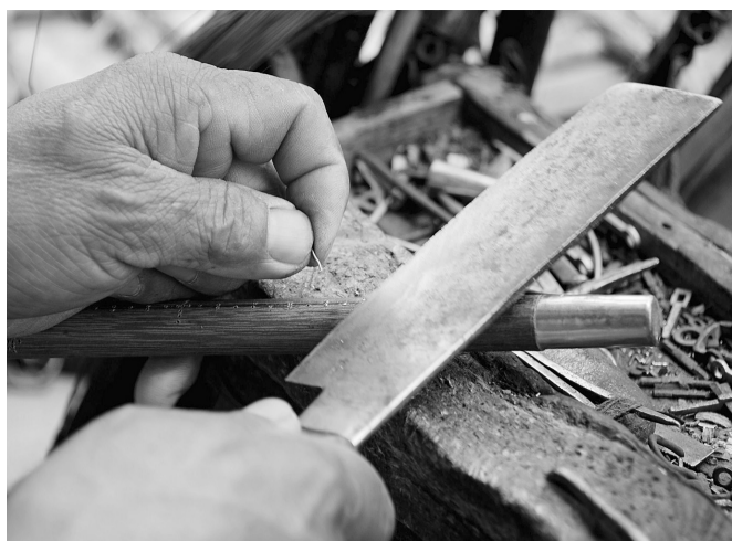
▲每个秤星都代表着天地良心,可不能马虎。