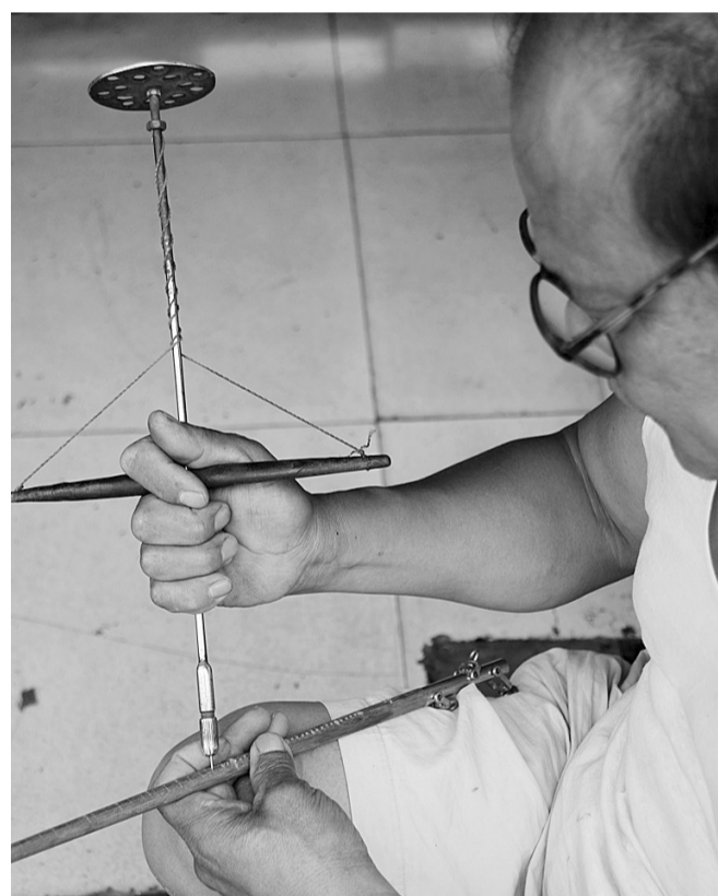
▲细小的秤杆上打孔是一道功夫活儿。