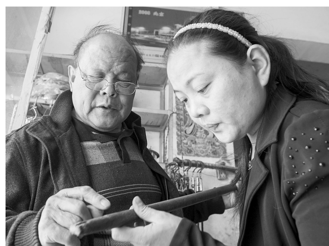
▲杆秤制作是口口相传下来的。