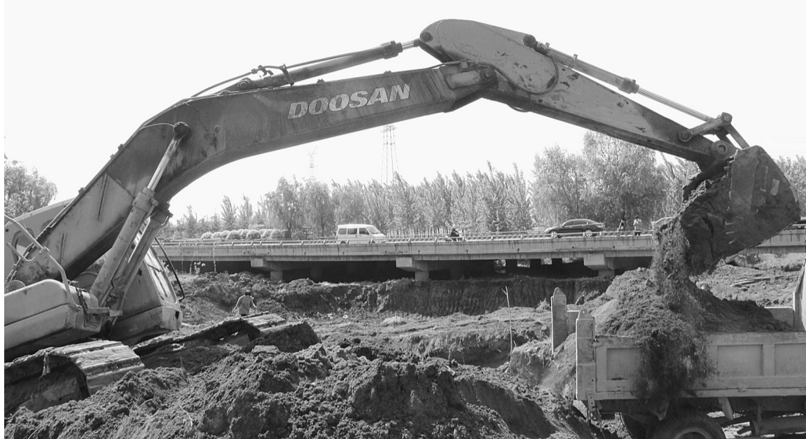
入夏以来，市中区及早部署，成立防洪排涝清淤应急抢险队，备足防汛物资和抢险设备，对辖区内水库进行排查除险，确保雨季能够迅速地排放雨水。图为5月12日，在税郭镇南安城村挖掘机正在河道清淤。(张晶 黄加芳 摄)

■修订后的《干部任用条例》坚持了好干部标准，是如何贯彻和体现的？ 习近平总书记在全国组织工作会议上强调，要着力培养选拔党和人民需要的好干部，并明确提出“信念坚定、为民服务、勤政务实、敢于担当、清正廉洁”的好干部标准，进一步丰富和发展了德才兼备、以德为先干部标准的时代内涵，既为广大干部明确了个人努力方向，也为干部选拔任用工作提供了重要遵循。修订后的《干部任用条例》，鲜明地将好干部标准写入总则第一条，并围绕有利于选好用好党和人民需要的好干部，提出了新要求。一是完善了选拔任用党政领导干部的基本条件和资格，突出了理想信念的要求，政治立场、政治态度、政治纪律的要求，坚持原则、敢于担当的要求，加强道德品行、作风修养的要求，树立正确政绩观，做出经得起实践、人民、历史检验实绩的要求。二是在考察内容上按照好干部标准，突出了品德、实绩、作风和廉政情况。三是拓宽干部选拔的来源渠道，注意从担任过县、乡党政领导职务的干部和国有企业事业单位领导人员中选拔，推进地区之间、部门之间、地方与部门之间、党政机关与国有企业事业单位及其他社会组织之间的干部交流。四是严把人选关，明确了六种不得列为考察对象的情形，包括群众公认度不高的，近三年年度考核有基本称职以下等次的，有跑官和拉票行为的，配偶已移居国(境)外或者没有配偶、子女均已移居国(境)外的，受到组织处理或者党纪政纪处分影响使用的，以及因其他原因不宜提拔的，把不符合好干部标准的人挡在考察人选之外。五是在程序和制度的设计上，把选好用好干部贯穿体现到选拔任用的各个环节，努力用科学的制度机制把党和人民需要的好干部及时发现出来、合理使用起来。