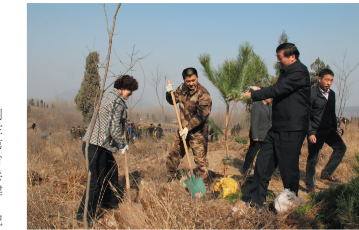
3月14日上午,市体育局干部职工积极参加义务植树活动,为全市创建国家森林城市、建设生态枣庄再添新绿。

入,助力文明生活场地扩大。新城体育中心一场两馆全面施工。投入800万元对老城体育中心进行了大规模维修改造。在300个行政村和社区实施了农民体育健身工程,工程覆盖全市2669个村居。为7个镇街、13个社区配置了健身器材。在全市123个行政村完成了“千村扶贫健身工程”地硬化。在环城森林公园健身绿道建设了8处休闲健身场所。山亭区启动了全民健身“雪碳工程”,峯城区文体中心即将竣工,其他区(市)都在积极推动体育场馆规划建设。目前,全市有三个(区)