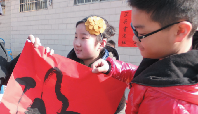
1月26日,山亭区西集镇大集上,两名小学生把自己创作的书法作品“福”字赠送一位老人。这是西集镇留守儿童活动中心开展的义务写春联活动的画面。