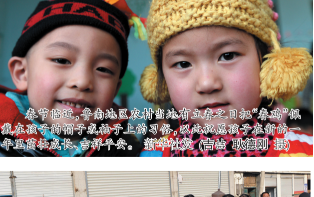
春节临近,鲁南地区农村当地有立春之日把“春鸡”佩戴在孩子的帽子或袖子上习俗,以此祝愿孩子在新的一年茁壮成长、吉祥如意。