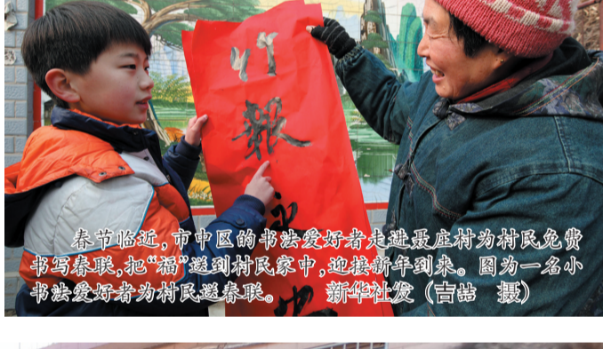
春节临近,市中区的书法爱好者走进枣庄村为村民免费书写春联,把“福”送到村民家中,迎接新年到来。图为一名小书法爱好者为村民写春联。