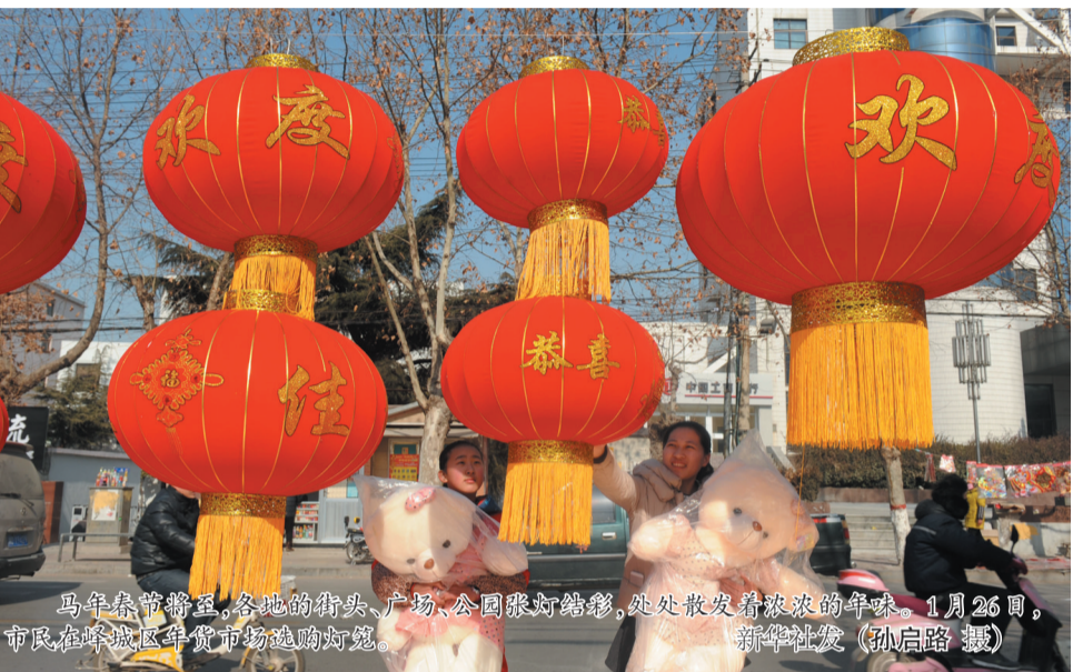
马年春节将至,各地的街头、广场,全国张灯结彩,处处散发着浓浓的年味。1月26日,市民在滕州市年货市场选购灯笼。

进。南山绿道顺利竣工通车,已成为高标准的森林绿道和景观大道。走在市郊,人们天天都能看到崭新的道路在脚下不断延伸。为了确保建设成果,该街道还对城乡环境实现管严格防控。公安、城管、矛调中心等部门,对辖区内的违法占地进行了集中清理,开展多次集中清理清查,对道路乱搭乱建和违章建筑予以全部拆除,还原了耕地60余亩,打击了违法占地行为。 为了维护节日的干净整洁,街道从环境整治、完善配套、健全机制三个方面入手,通过成立领导班子,强化宣传、完善配套人员和设备、健全和强化督导机制等方面,成立了专门的领导小组,安排值班人员130多人,实行环卫工人24小时不间断。各村居的40辆垃圾收集车,不定时运送各类垃圾,7个垃圾中转站满负荷运转。