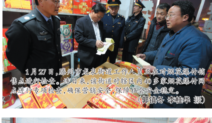
1月27日,滕州市龙泉街道工作人员正在对烟花爆竹销售点进行安全检查。连日来,该街道对辖区内40多家烟花爆竹销售点进行专项检查,确保销售安全,保障群众生命财产安全。