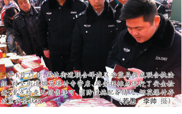
1月27日,峄山区街道联合峄山区安监局组成联合执法组,对全区烟花爆竹销售点进行安全检查。重点检查是否销售许可、消防设施配备情况、烟花爆竹存放是否安全。