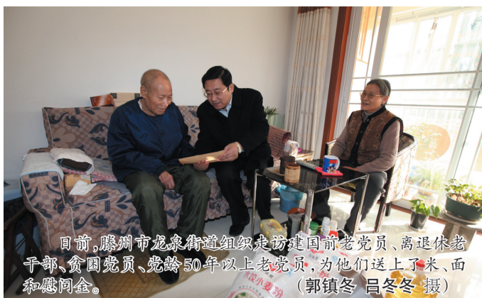
日前,滕州市龙泉街道组织走访慰问老党员、离退休老干部、贫困党员、党龄50年以上老党员,为他们送上了米、面和慰问金。

西集”。结合省级文明城市工作先进区和市级“四德”工程示范区创建工程,活跃城乡文化生活,深入推进乡村文明行动,确保群众满意度考核取得优异成绩。坚持保护、开发并举的原则,重点实施普照寺考古、鲁南伏羲文化产业园建设、伏里土陶博物馆建设工程,发展壮大文化旅游商贸服务业,培植镇域经济发展新的增长点。五是深入开展党风廉政建设和反腐败斗争,努力营造风清气正的良好氛围,努力构建和谐社会。 (赵连友)