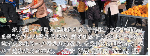
连日来,山亭区山城街道开展“干部联手包户”党员联系户“春节大走访”活动,所有科级干部、机关干部每人结对走访慰问一户计生困难家庭、老党员及特困家庭等,送去了党和政府的温暖。