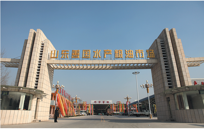
山东国水水产粮油批发市场