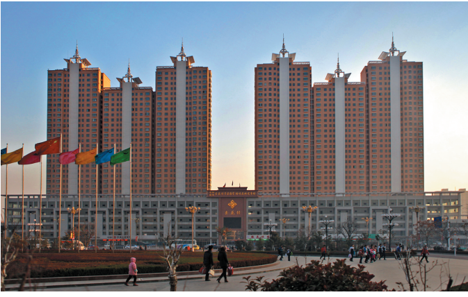
杏花村干杂海货批发市场