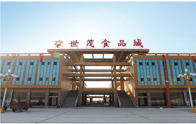
国家级食品安全检测中心及专供市场