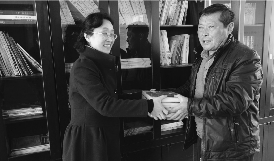
情系农家 捐建书屋

活动开展以来，榴乡大地处处成了进民家、知民情、解民忧的“服务园地”，广大党员干部走出机关、走进基层，实现了作风的朴素回归。