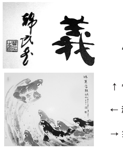
↑ 怀德养义(隶书) 韩氏作 ← 鸿运当头(局部 国画) 刘继伟 作 → 笑口常开(局部 国画) 王新伟 作