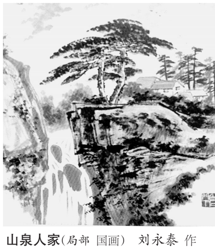
山泉人家(局部 国画) 刘永泰 作