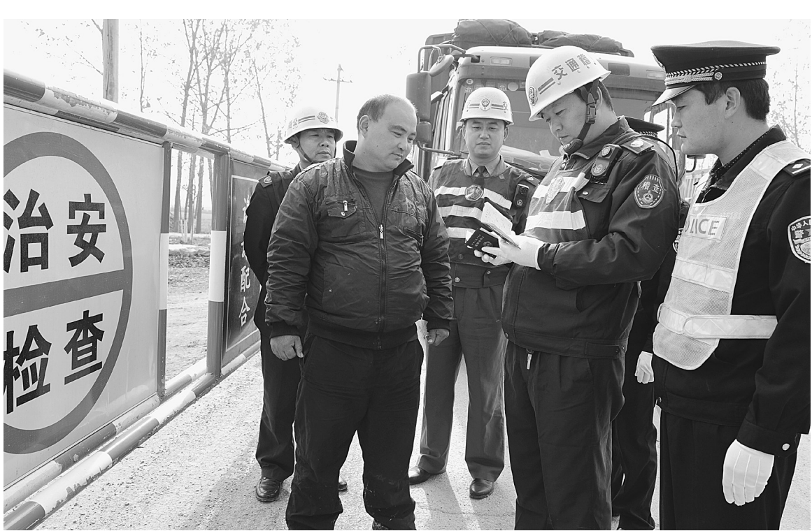
为强化道路交通秩序与安全,峰城区有关部门近日开展冬季大检查活动,对超载的货车、机动车进行严格处罚,改善了道路环境,提升了城市文明形象。

(上接第一版)薛城区从薄弱环节整治入手,结合“美丽薛城·一起行动”,对全区23个重点路段和重点行业、区域实行区级领导帮包责任制,落实了牵头单位、责任单位和职能部门责任人,明确治理标准,每周二、五下午组织机关人员开展义务劳动。今年以来,共开展集中整治活动15次,清运垃圾450余吨,铲除卫生死角49处;粉刷大型墙壁宣传画1100多幅。启动建设了总长度2公里的永兴路升级改造工程和1500米的沿河巷、长青巷等背街小巷改造工程;全面推行强弱电、燃气、供排水、污水等地下管网下地工程;投资100余万元,在沿河路和燕山路建设疏林停车位260个。着眼提升城市绿化水平,实施了临山阁周边山体绿化、黄河东路绿化、长白山南路、榴园大道东段绿化等工程,累计栽植各类苗木460万株,建成生态长廊1200米,新增线性绿地51万平方米。累计新建改建街头绿地、广场游园21处,创建“花园式小区”42个。目前,城区绿化率达到42%,人均公共绿地面积由9.6平方米提升到11.8平方米,泰山南路、长白山路、祁连山路等7条道路绿化等成为全市亮点。