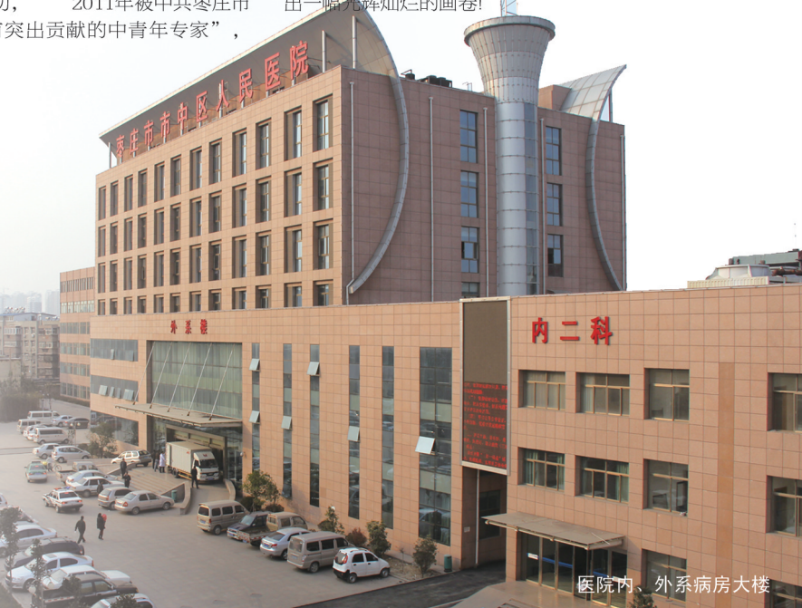
医院内、外系病房大楼