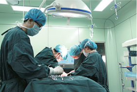
现代化层流手术室