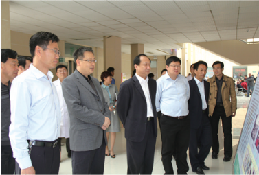
市委组织部来院调研人才工作