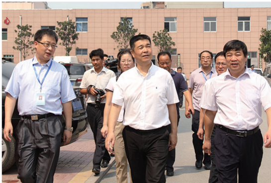
副市长、市中区委书记霍高原来医院视察

仁爱至诚，硕果累累。目前，市中区人民医院的综合竞争能力大大提高，门诊量同比增长36.8%，床位数量由211张增至600余张，医院总收入以每年35%的速度快速增长，职工年收入比五年前平均每人增加84%。2009年医院荣获枣庄市卫生局全市卫生系统“两好一满意”示范集体；2010年被山东省疾病预防控制中心评为全省传染病信息网络直报先进集体、枣庄市卫生局医学会工作“先进单位”和 枣庄市药品不良反应和医疗器械不良反应时事件监测工作“先进集体”；2011年被枣庄市委评为“枣庄市先进基层党组织”，被枣庄市总工会评为“工人先锋号”，2012年荣获“省级文明单位”和“山东省群众最满意医院”光荣称号，并以全市第一名的成绩通过了二级甲等医院等级评审。周爱国同志2008年被省委、省政府授予“山东省先进工作者”，2009年度获市委市政府嘉奖，2010年度获市委市政府表彰三等功，2011年被中共枣庄市委、市政府评为枣庄市“有突出贡献的中青年专家”，