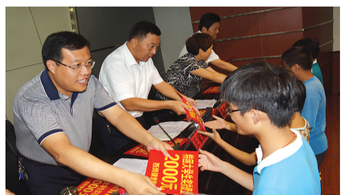
8月20日下午,滕州市西岗镇举行“圆梦助学”活动,对40名特困大学生现场发放奖励扶持资金6.2万元。