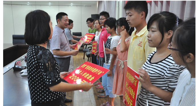
8月29日下午,滕州市级索镇举办2013年贫困大学生救助仪式,该镇持续加大慈善助学力度,今年确定了35名救助对象,每人给予2000元的救助,救助金共计7万元。