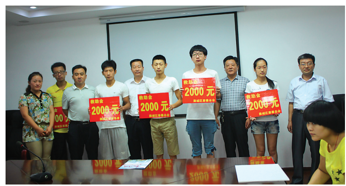
8月29日上午,薛城区临城街道和薛城区慈善总会共同举办了“朝阳助学”助学金发放仪式,共资助困难家庭和低保家庭学子29人,发放助学金66000元。