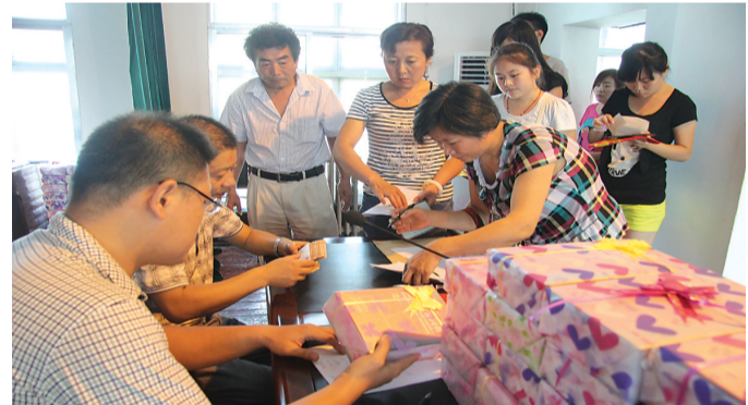
日前,滕州市北辛街道对特困大学生进行现场救助,帮助他们圆上大学的梦想。今年,街道拿出了38.2万元对136名特困大学生进行了救助,创下了历年来救助大学生资金金额之最。

↑为检验全镇城乡环卫一体化示范村创建成果,8月31日上午,滕州市柴胡店镇召开城乡环卫一体化观摩验收现场会,镇党委书记、人大主席黄传军,党委副书记、镇长王宁带领镇副科级以上干部、办事处党总支书记、党政办、组织科、宣传科、调研室、公路管理站、执法办等相关部门负责人以及21个创建示范村的主要负责同志对全镇21个城乡环卫一体化创建示范村进行了现场观摩。