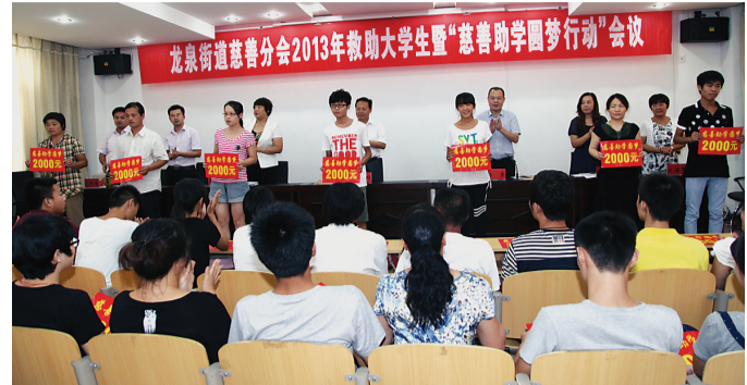
8月28日,滕州市龙泉街道慈善分会开展2013年救助特困大学生“慈善助学圆梦行动”,现场为47名特困大学生发放救助金9.2万元。

大,只有建立健全环卫资金、管理和使用制度,充分调动社会各方面的力量,才能从财力和意识上保障环卫一体化长效运行。 为此,该镇本着“环境卫生千部群众人人有责”的原则,号召镇域范围内各企事业单位、沿街沿街个体经营业户、一般农户,按照相关规定积极交纳卫生管理费。仅仅一周的时间就收到卫生管理费64.5万元,其中农户交费47.76万元、企业交费8万元、个体经营户交费8.74万元。该镇对收取的环境卫生管理费将专款专用,并对保洁员工资绩效考核,以“一卡通”的形式发放到位,充分调动保洁员工作积极性,确保环境卫生长期保洁。 在采访结束时,笔者遇到一位主动丢送垃圾的村民李某,她说:“看着村里这么干净,镇、村干部那么辛苦,趁出门的时候就把垃圾送到处理中心来了”。看来镇、村干部工作作风的转变,让群众耳濡目染,不由自主的发生了改变,现如今群众意识已成为环卫一体化长效运行的动力。(张玉春 孙刚)