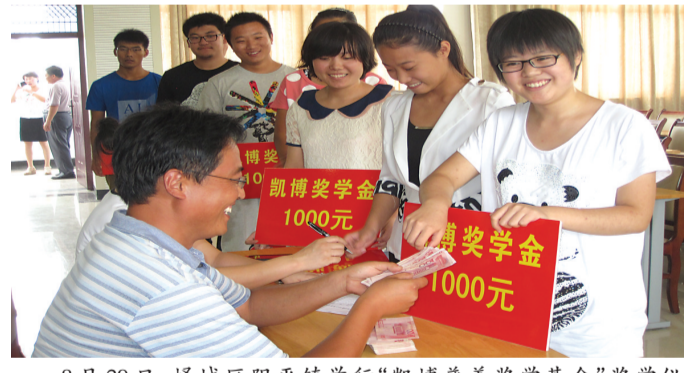
8月29日,滕州市北辛街道对特困大学生进行现场救助,帮助他们圆上大学的梦想。今年,街道拿出了38.2万元对136名特困大学生进行了救助,创下了历年来救助大学生资金金额之最。

个人申请,通过家庭走访等形式确定特困新生,帮助他们圆自己的大学梦想。本次活动除现金救助外,还将通过助学贷款等救助方式多渠道为贫困生提供服务。 (赵庆) 滕州讯 日前,善南街道开展“关爱希望、共建和谐”慈善救助活动,为14名贫困大学生发放助学金28000余元,为贫困学子打开了希望之门。为了帮助家境贫寒而品学兼优的莘莘学子顺利步入大学的校门,善南街道提前做好调查摸底工作,于7月初召开座谈会,要求各社区、各居做好调查,掌握贫困大学生情况,并做好政策宣传,让寒门学子及早申报街道慈善分会慈善助学金。根据前期摸底调查和街道慈善分会审核,今年辖区有14名新录取大学生符合慈善助学条件,并于日前组织召开了助学金集中发放仪式。 (赵红艳)