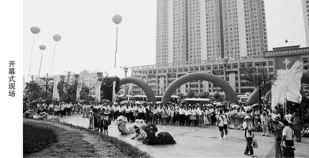
中外客商应邀参加